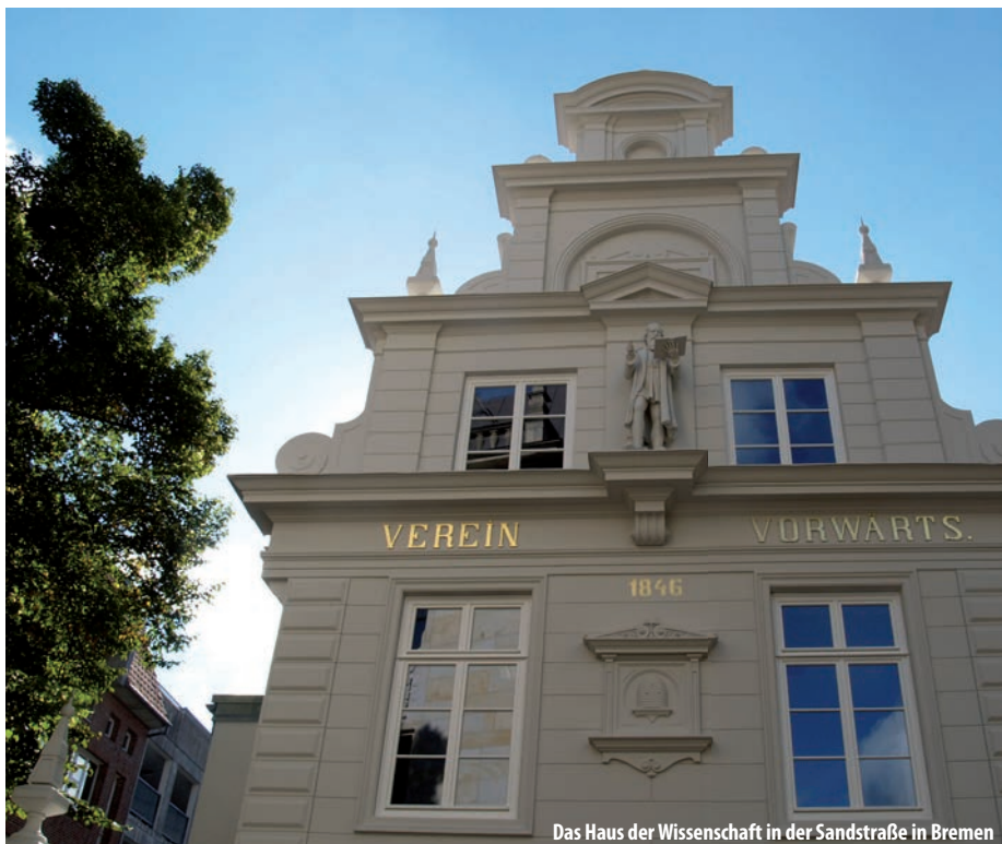
Das Haus der Wissenschaft in der Sandstraße in Bremen