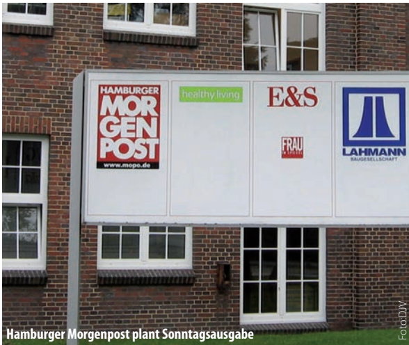
Hamburger Morgenpost plant Sonntagsausgabe