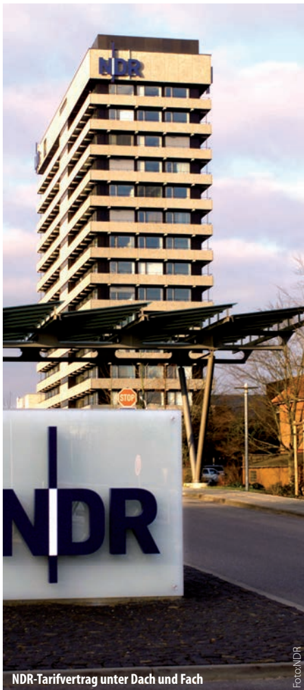
NDR-Tarifvertrag unter Dach und Fach