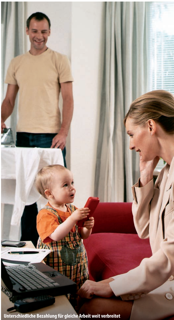
Unterschiedliche Bezahlung für gleiche Arbeit weit verbreitet