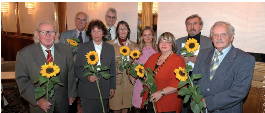
Gruppenbild mit Sonnenblume: Die langjährigen Verbandsmitglieder, allesamt Journalisten mit Leib und Seele, erhielten die DJV-Ehrennadel.