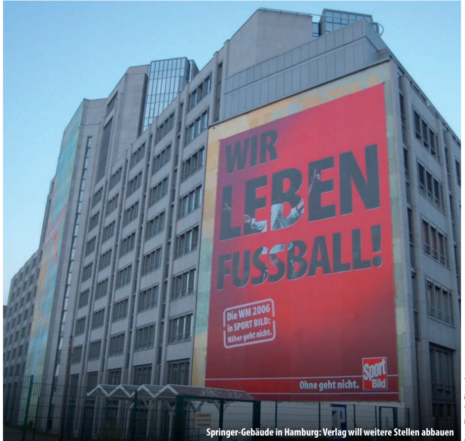
Springer-Gebäude in Hamburg: Verlag will weitere Stellen abbauen