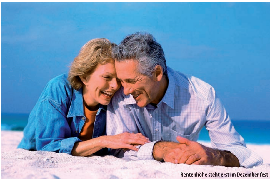
Rentenhöhe steht erst im Dezember fest