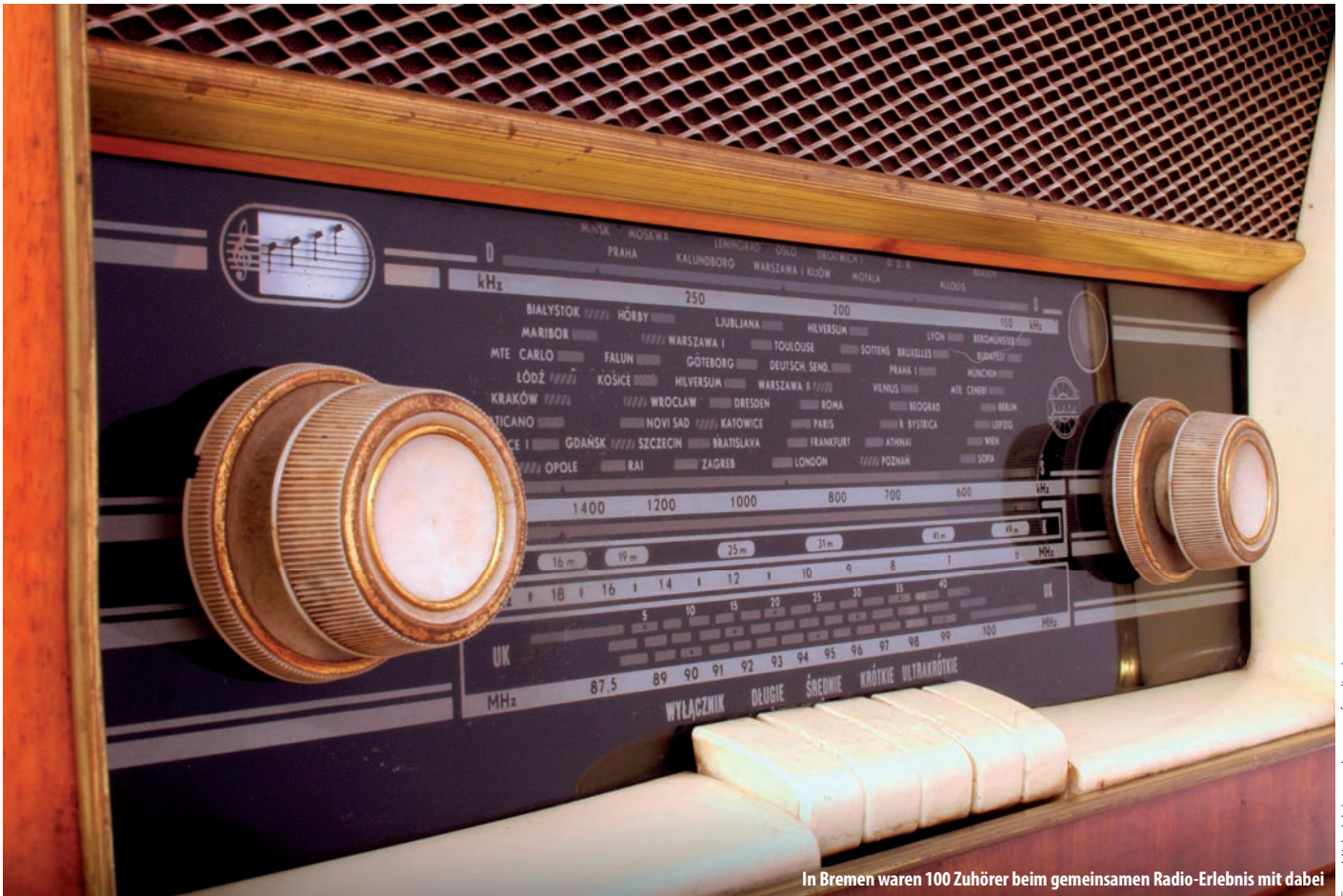
In Bremen waren 100 Zuhörer beim gemeinsamen Radio-Erlebnis mit dabei