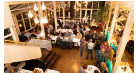
Das beliebte Café Sand war Austragungsort der Bremer DJV-Sause