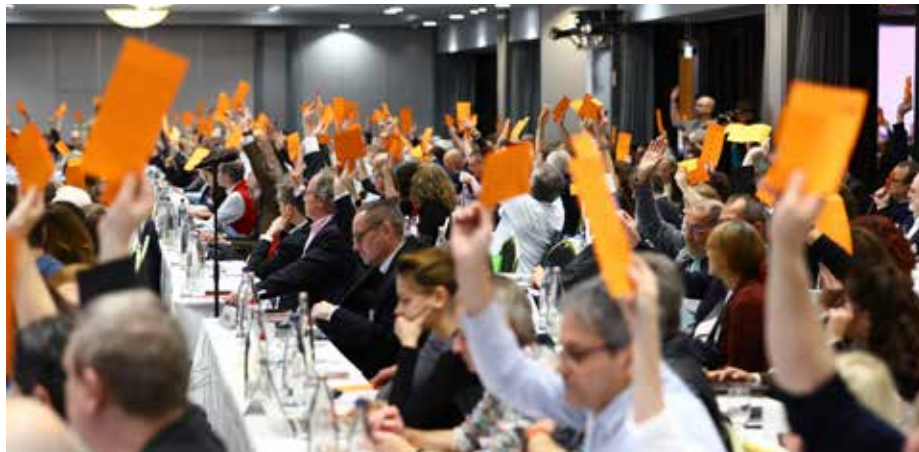
Beim Bundesverbandstag des DJV in Dresden ging es auch um die Zukunft des Verbands

Eine klare Absage an politischen Extremismus stand im Mittelpunkt des DJV-Bundesverbandstages im November. In der dort verabschiedeten Dresdner Erklärung heißt es: „Journalistinnen und Journalisten im DJV treten in ihrem Beruf aktiv für die Demokratie und ihre Grundwerte, insbesondere für die Presse-, Rundfunk- und Meinungsfreiheit, ein. Die Mitgliedschaft im DJV und Positionen, welche die Pressefreiheit bzw. die freie, ungehinderte Ausübung des Journalistenberufes einschränken wollen, sind miteinander nicht vereinbar.“ Für den Bundesvorsitzenden Frank Überall ein wichtiges Bekenntnis: „Die Dresdner Erklärung unterstreicht unser aktives Eintreten für die Pressefreiheit.“ Darin fordert der DJV alle politischen Parteien dazu auf, sich zur Pressefreiheit zu bekennen und die freie und ungehinderte Ausübung des Journalistenberufes zu sichern. Die mehr als 200 DJV-Delegierten diskutierten auch mit dem sächsischen