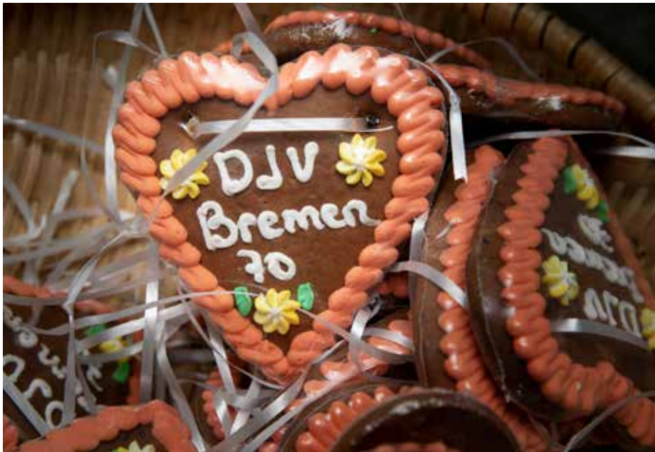
70 Jahre jung: Zum Jubiläum feierte der Bremer Landesverband am Weser-Strand

Sich treffen, klönen, Pläne schmieden und in Erinnerungen schwelgen: Als sich rund 80 Kolleginnen und Kollegen im Café Sand trafen, um bei Gegrilltem und kühlen Getränken das 70-jährige Jubiläum des DJV Bremen zu feiern, stand genau das im Vordergrund. Wieder einmal, denn schon den 60. und 65. Geburtstag haben die Bremer mit einer ähnlich positiven Resonanz gefeiert. Auf der jüngsten Klausurtagung des DJV Bremen entstand deshalb die Idee, in kürzeren Abständen und in einem anderen Rahmen Veranstaltungen mit einem geselligen Charakter auf die Beine zu stellen – mehr dazu demnächst! Erst einmal aber stand im September 2018 der 70. Geburtstag im Vordergrund. Und ein kurzer Blick zurück in die Geschichte: Am 2. September 1948 wurde die Bremer Journalistenvereinigung gegründet, am 23. Oktober 1948 fand die erste Mitgliederversammlung statt. Damals