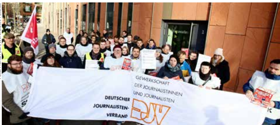
Ende November legten die Mitarbeiter von Computer Bild für mehrere Stunden die Arbeit nieder

„Wir sind Schnäppchen“ – unter diesem Motto haben die Beschäftigten der Computer Bild Ende November für einen Richtungswechsel und einen Haustarifvertrag demonstriert. Der mehrstündige Warnstreik schloss sich an eine Mittagspausen-Kundgebung von DJV und Verdi an. Die Arbeitsniederlegung war notwendig geworden, weil Axel Springer es weiterhin ablehnt, den Beschäftigten seiner Tochterfirma Tarifgehälter zu zahlen. Auch nach zahlreichen Tarif-Verhandlungsrunden bietet der Konzern für die Redakteurinnen und Redakteure der Computer Bild noch nicht einmal die Gehälter an, die Springer in seiner Bild GmbH bezahlt. Und selbst diese Gehälter liegen erheblich unter dem Tarifniveau.