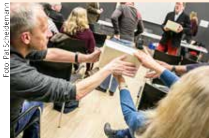
Der DJV lädt zur Mitgliederversammlung in Kiel ein – u.a. mit Wahlen von Kassenprüfern, Delegierten und Mitgliedern der Fachgruppen