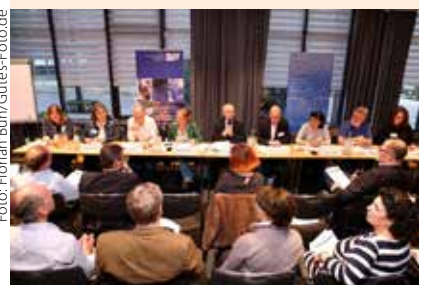
Auch dieses Mal tagt der DJV im Madison Hotel