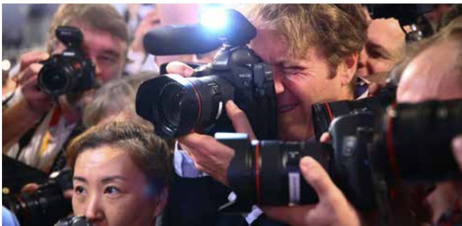
Wo beginnt das Persönlichkeitsrecht von Prominenten, die im Rampenlicht stehen?

Wie weit reicht die Pressefreiheit, wenn es um die Privatsphäre von Prominenten und normalen Bürgerinnen und Bürgern geht? Diese Frage muss täglich in den Redaktionen diskutiert und neu beantwortet werden. Ebenso regelmäßig wird vor den Gerichten darüber gestritten. Der Bundesgerichtshof hat nun in einer Entscheidung vom Juni 2018 (BGH, Urteil vom 12.6.2018 – VI ZR 284/17) eine interessante Entscheidung gefällt. Das Urteil stellt klar, dass eine Berichterstattung auch aus der Privatsphäre von Prominenten rechtmäßig sein kann. Der Fall: Die Freizeit Revue berichtete unter der Überschrift „Begegnung mit dem verlorenen Bruder“ über die Familienverhältnisse eines sehr bekannten Schauspielers und Musikers, seines Stiefbruders, ebenfalls bekannter Schauspieler, und dessen Ehefrau. Der Kläger hatte daraufhin vor dem Landgericht Köln unter Verweis auf sein allgemeines Persönlichkeitsrecht, das das Recht auf Achtung der Privatsphäre umfasst, eine Unterlassungsverfügung erwirkt. Auch das Oberlandesgericht Köln stützte die Entscheidung in der Berufung weitgehend. Mit ihrer Revision hatte die Freizeit Revue jedoch Erfolg: